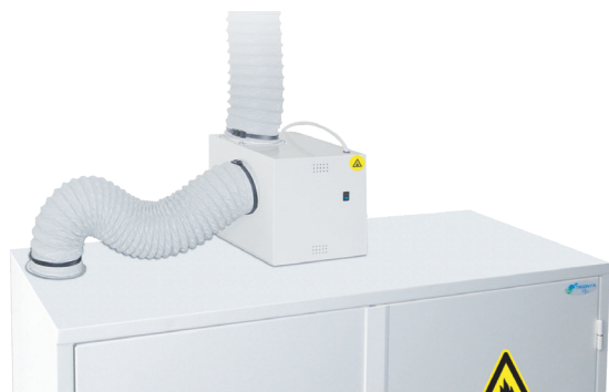
▲ CDV-A + option KRC + option KL100 + option CDS100