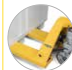
Déplacement par transpalette (à vide)