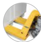
Déplacement par transpalette (à vide)