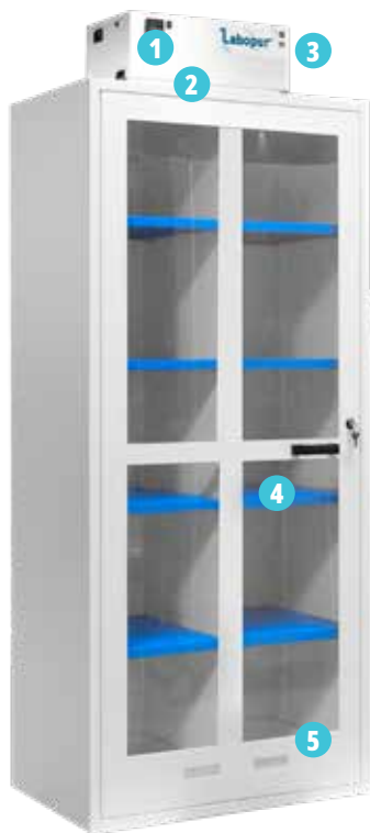
▲ AFP22 + CORGFC