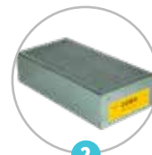
Filtre à charbon actif spécialisé