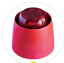
1 Alarme visuelle et sonore

VIG190 - Ensemble de sécurité et d'alarme comprenant (ou VIG290, VIG590) :