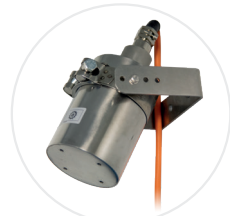
Extincteur spécial lithium