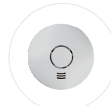
Détecteur de fumée connecté ALARMWI