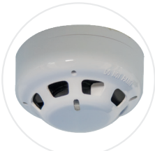
Détecteur de fumée à déclenchement automatique