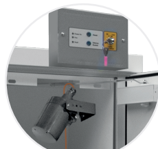
2 Boîtier de contrôle