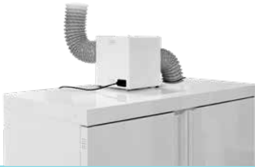
▲ CDV-A + option KRC + option KL100 + option CDS100