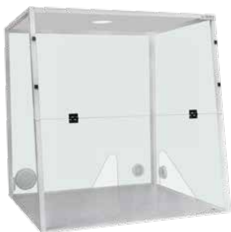
▲ BH09D+ + BB09