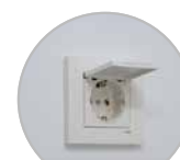
3 Prise électrique intérieure