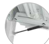
2 Vitre de protection avec verin et lampe