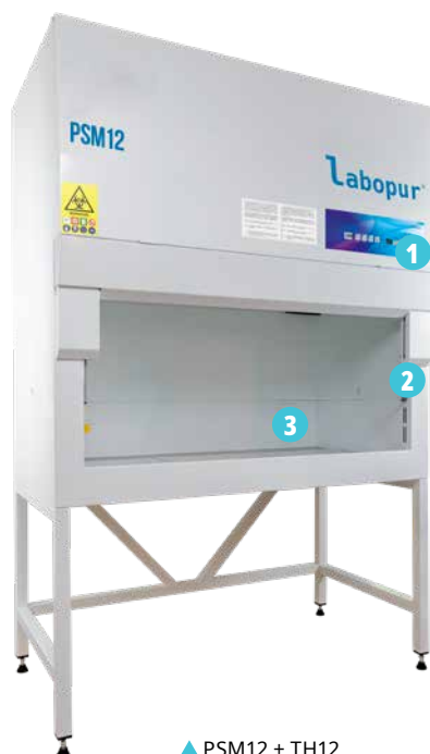
▲ PSM12 + TH12