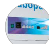
1 Système de contrôle automatique