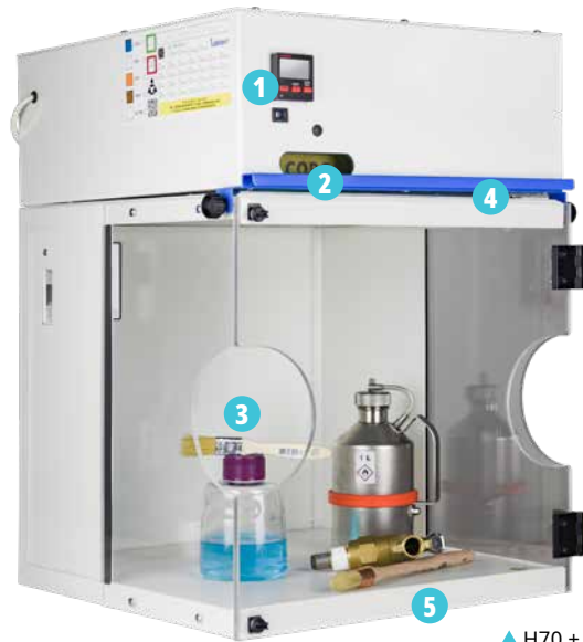
▲ H70 + CORG51