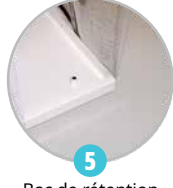
5 Bac de rétention intégré