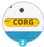
2 Fenêtre de visualisation