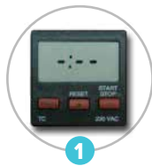
1 Compteur horaire