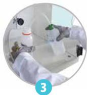
3 Passage de mains