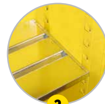
2 Étagères réglables sur crémaillères