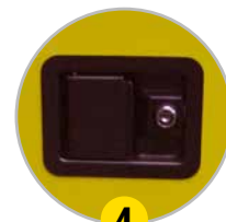
4 Poignée de porte intégrée