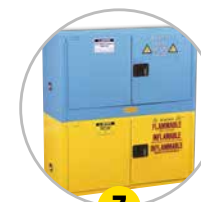
7 Armoires superposables