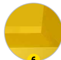
6 Fond étanche de rétention