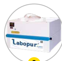
8 Caisson à recirculation d'air