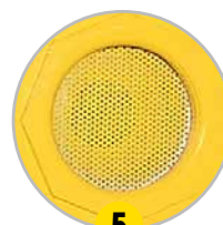
5 Ventilation avec grille pare-flammes