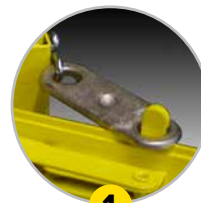
1 Fermeture à thermofusible (selon modèle)