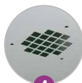
4 Orifices de ventilation