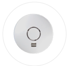
Détecteur de fumée connecté ALARMWI (option)