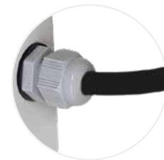
Passage des câbles PEXTBALI14 (option incluse avec PRISEL14)