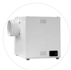
Caisson de ventilation CDV-A (option)