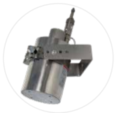
Extincteur EX100LI/EX200LI (option)