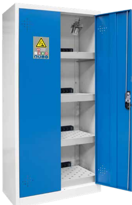
▲ AZ301BLI + 4 PRISEL14 + EX200LI + PEXTBALI14