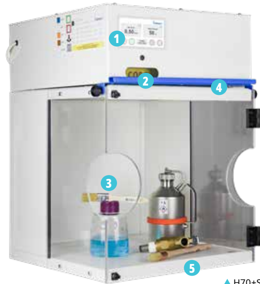
▲ H70+S + CORG51