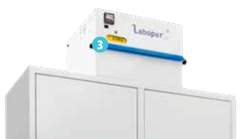
▲ H50+ + CORG51