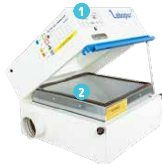
▲ H50+S + CORG51 (changement de filtre)