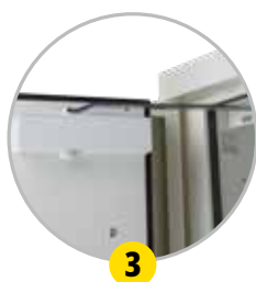
Ferme-porte avec thermofusible