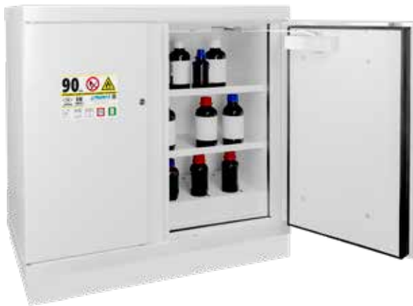
▲ 793+E + C35