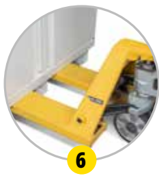
Déplacement par transpalette (à vide)