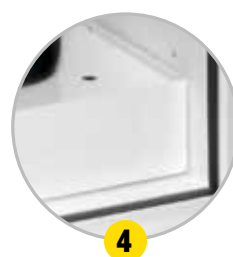
Bac de rétention amovible