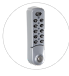
Option serrure à code SERCODE