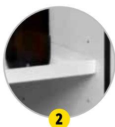
Étagères de rétention