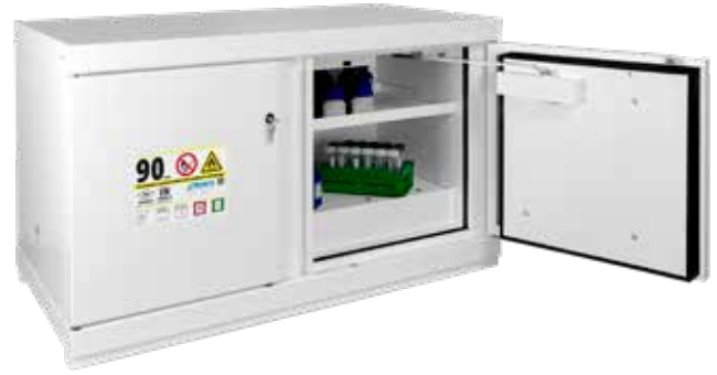
▲ 792+E + C2