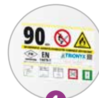
1 Pictogramme normalisé