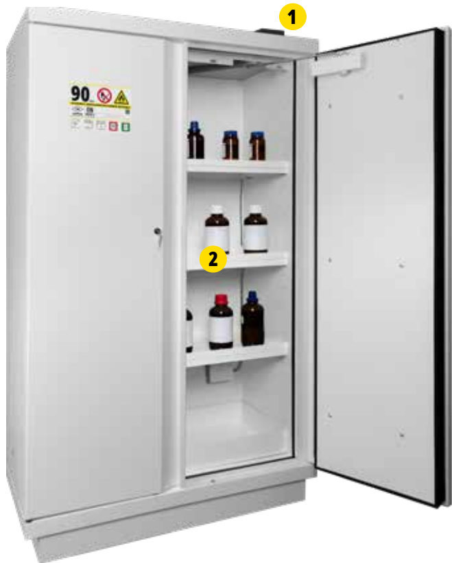
795+E + 3x(SCIA35 + SE35 + ABOSCIA + ABOLOIA) + PEXTBAIA + CABIA + CAPRIA10 + E4GIA