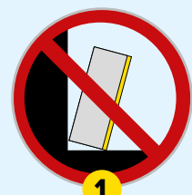
Kit pour fixation murale