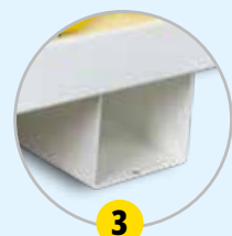
Fixations au sol