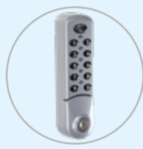
Option serrure à code SERCODE (1 par porte)