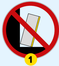
1 Kit pour fixation murale