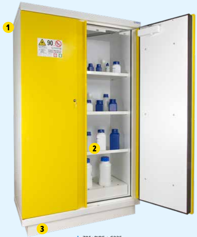
▲ 795+PJBE + C235