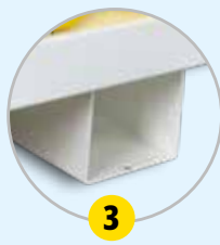
3 Fixations au sol