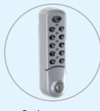
Option serrure à code SERCODE (1 par porte)