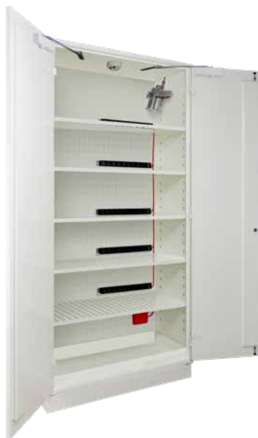
▲ S2004+LIA5 + 5 PRISELI + GL04 + 2 PEXTBALI50