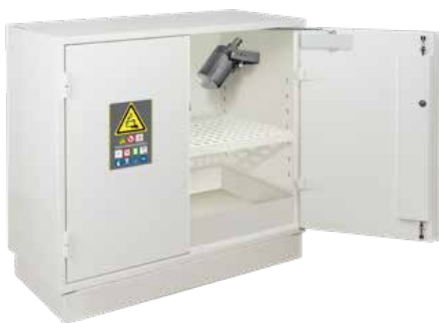
▲ S806+LIA1 + PRISELI + GL06 + PEXTBALI50

15 min Construction coupe-feu (de l'intérieur vers l'extérieur) certifié EI 15 min type A1, selon la norme NF EN 13501-1 .