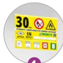
1 Pictogramme normalisé