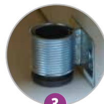
3 Pieds vérins pour mise à niveau