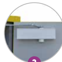
2 Ferme-porte avec thermofusible