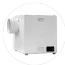
Caisson de ventilation CDV-A (option)