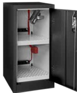
▲ AZ51NLI + 2 PRISELI + EX100LI + PEXTBALI14