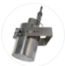
Extincteur EX100LI/EX200LI (option)