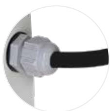
Passage des câbles PEXTBALI14 (option incluse avec PRISELI14)

Hottes et armoires à filtration - Ventilation