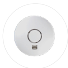
Détecteur de fumée connecté ALARMWI (option)