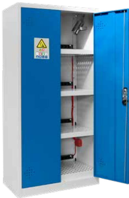
▲ AZ301BLI + 4 PRISELI14 + EX200LI + PEXTBALI14