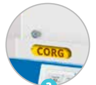
3 Fenêtre de contrôle de présence du filtre