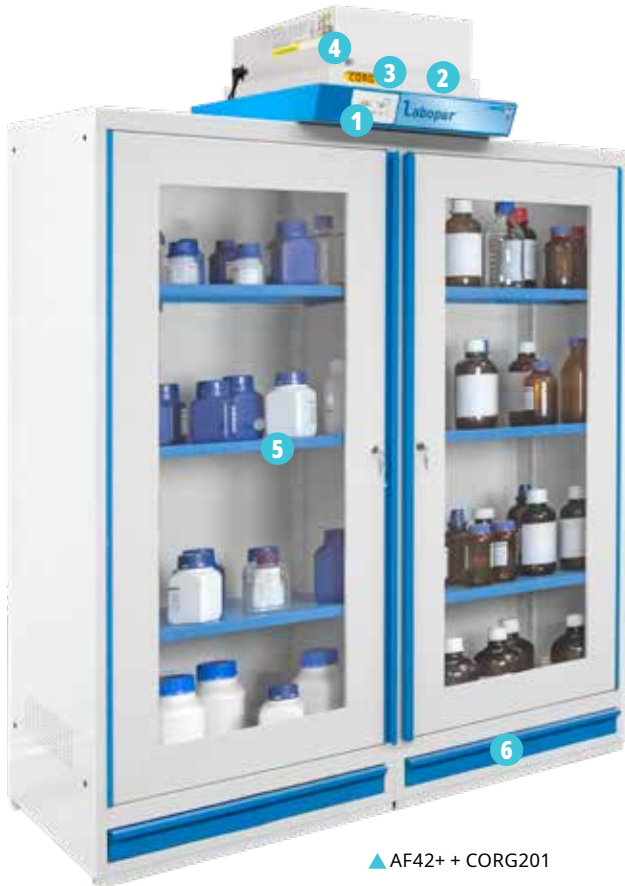
▲ AF42+ + CORG201