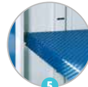
5 Étagères perforées réglables en hauteur