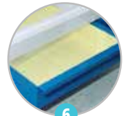
6 Tapis absorbant dans le bac de rétention